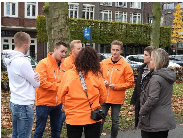
21 november 2021: Jong Samen voor Valkenswaard op pad

Grote moeite hebben wij met plannen die ten koste gaan van de huidige bewoners uit de omgeving. Zowel voor de Leenderweg als voor de Parelweg Noord wordt gemakshalve voorbijgegaan aan parkeernormen. Natuurlijk willen wij ook zo snel mogelijk zo veel mogelijk woningen erbij. Maar wij vergeten niet de bewoners die er dadelijk de dupe van worden. Oplossingen waren er, maar daar had het college geen behoefte aan.