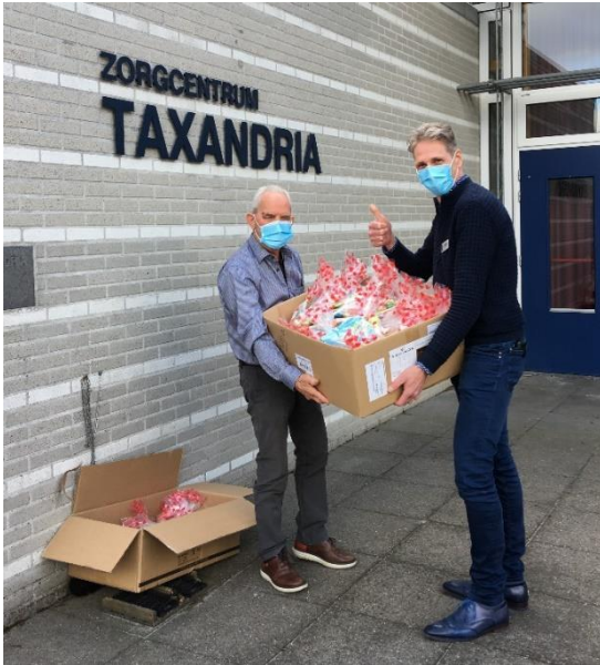
Paasactie Taxandria 2021

Wij laten van ons horen. Het hele jaar door!